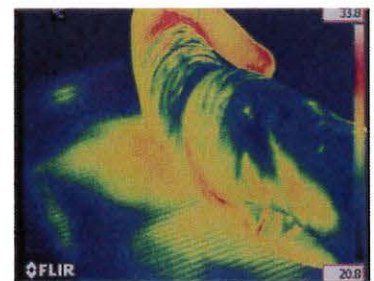
▲赤外線サーモグラフィ画像

災害時に緊急避難場所等、コンクリートなどの冷たく硬い床で、長時間待避することが想定されますが、 空気を使用しているため、クッション性・断熱性に優れており、緊急時の身体的な負担を軽減します。 また、各空気層は独立しているため、空気層の一つが破損しても、他の空気層に影響を与えることはなく、安心してご利用頂けます。空気の逆流を防いで高い気密性を保つ逆止弁構造で、空気注入後、3ヶ月は空気が抜けることはありません。