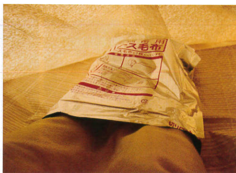
▲ 毛布のパッケージは足元の保温用として使用可能