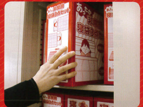
片手で簡単に取り出せます