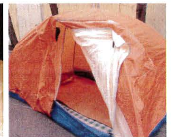
▲テントでの使用例