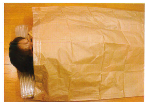
▲ エアーマット使用時