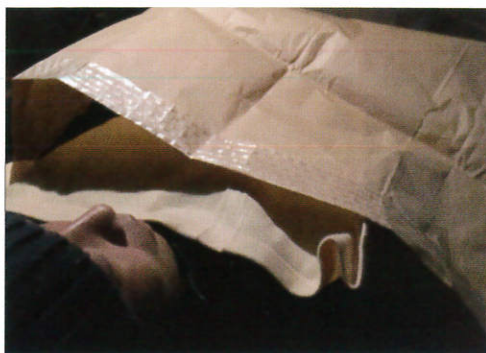
▲ 大人の男性も首元まで収まるゆったりサイズ