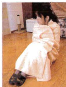
▲ゆったりサイズの毛布