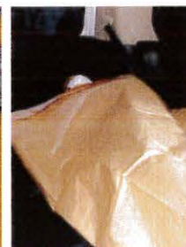
▲車中でも使用可能